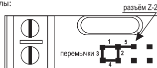
Рис.1 Положения переключки.

*Разъем Z-2 служит для подключения к компьютерному адаптеру Z-2 . Через него производится запись базы ключей из компьютера в контроллер и чтение базы ключей из контроллера в компьютер.